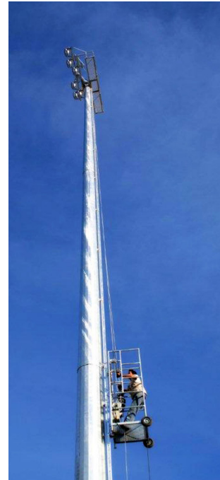
Acessório - Carro Móvel de Acesso