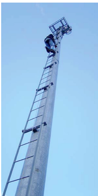
Acessório - Escada com linha de vida e cinto de segurança