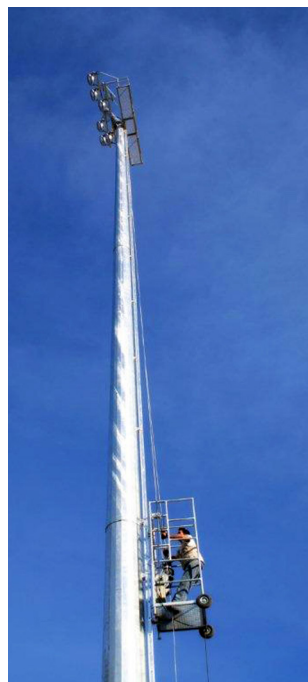
Acessório - Carro Móvel de Acesso