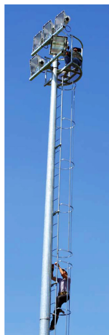
Acessório - Escada com proteção de Homem