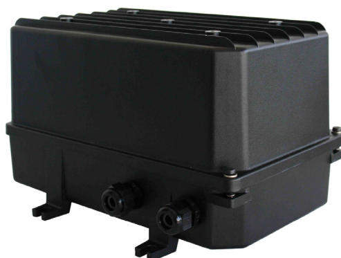
Acessório - Caixa Estanque

A - 340mm B - 240mm C - 200mm D1 - 150mm D2 - 225mm